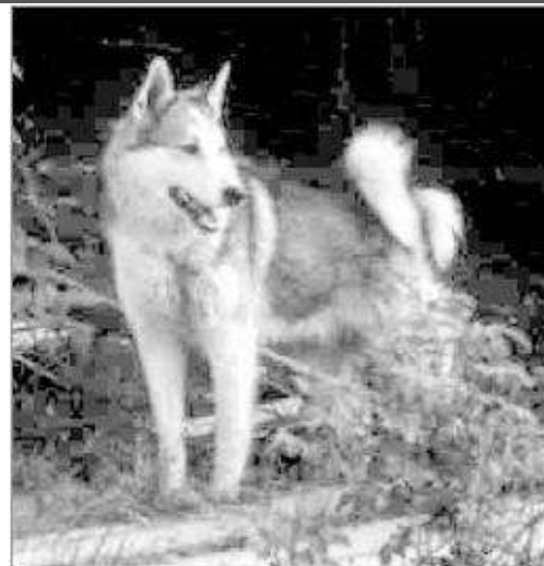
Рис. 29. Лайка (с. Тыр). 1996 г.