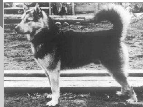
Рис. 15. Амурская лайка. (Альбом К.Г. Абрамова №14638-30).