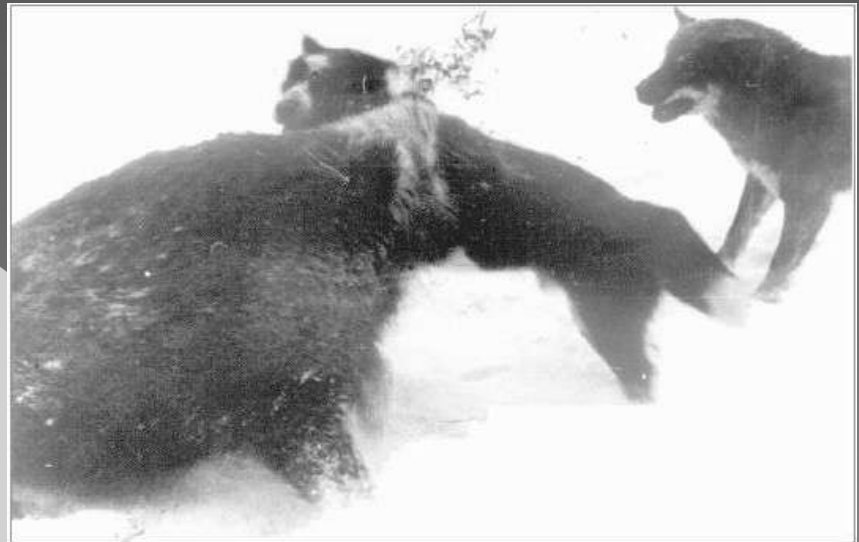
Рис. 11. Поединок амурских лаек с кабаном. (Альбом К.Г. Абрамова №14638–30).