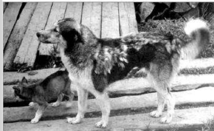
Рис. 30. Кормящая сука (с. Тыр). Фото автора, 1996 г.